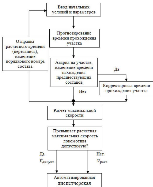
Рис. 2. Схема алгоритма расчета максимально допустимой скорости

Ниже представлена схема расчета максимально допустимой скорости на заданном участке (рис. 2). Время разгона, торможения при максимально допустимой скорости жестко связано с техническими характеристиками тягового электродвигателя локомотива, количества вагонов, а также их загруженностью. В зависимости от времени простоя предыдущего поезда в конечном пункте может быть произведен перерасчет максимальной скорости движения на участке для следующего локомотива. Данный расчет необходим и жестко связан с технологией производства.